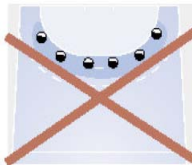
Verboten: Defensive 1-Linien-Abwehr